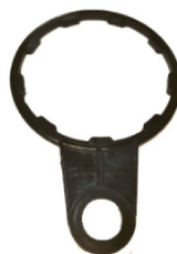
Ключ для затягивания кольца.

В целях предотвращения утери крышки, последняя соединяется с кольцом капроновым шнуром. В клапане применяется уплотнительное кольцо 034-038-25 по ГОСТ 9833-73.