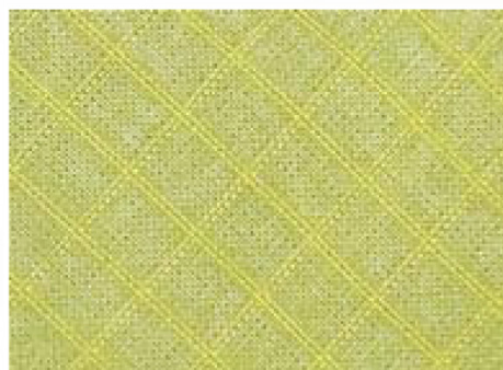
Polyester Rip Stop