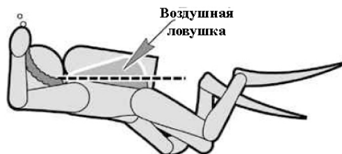
Рисунок ниже показывает преимущество крыла не подверженного обертыванию. Воздух в крыле теперь ниже уровня точки соединения инфлятора с крылом, позволяет дайверу свободно стравить воздух из крыла с помощью предохранительного клапана в локте инфлятора или через кнопки управления инфлятором. Крылья Travel, Trec и Rec, каждое имеет средство защиты от обертывания вокруг одного баллона.

Перед использованием крыла с одним баллоном вы должны учесть следующие факторы. На рисунке показана схема распределение воздуха, при срабатывании, с одним баллоном, и с использованием крыла без стягивающего шнура. Воздух в камере заставлял крыло обертывать баллон. Воздух оказывается в “ловушке”, выше точки соединения инфлятора ск крылом, как следствие он не может быть стравлен из воздушной камеры.